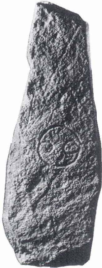
Fig. 2: stele istoriata della Briccola

Il carattere di area sacra per il culto degli antenati della antica necropoli settentrionale di Castelletto Ticino (significativamente ricadente in una fascia di territorio che ancora oggi comprende il cimitero storico) si legava anche all'evidenza monumentale, che doveva colpire, prima dell'effettiva entrata nell'insediamento, coloro che vi giungevano o dal porto della Briccola o dalla via che seguiva l'antica costa del Lago Maggiore, grosso modo corrispondente all'attuale Via Beati. Per questo grandi stele monolitiche dovevano contrassegnare le tombe più importanti ed esterne o comunque delimitare i vertici dell'area.