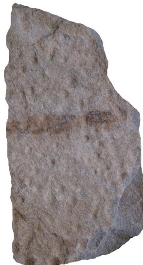
Fig. 3: stele coppedata di via Beati

Purtroppo i normali lavori agricoli dall'età romana in poi hanno fatto sì che nessuna di queste stele sia stata finora trovata in posto: una di queste fu rinvenuta in giacitura secondaria sopra al porto della Briccola nel 1970, e doveva ergersi nei pressi: attualmente al Museo di Varese rappresenta le armi di un guerriero (lancia, disco-corazza) ed una serie di coppelle e si data intorno alla metà del VII secolo a.C.