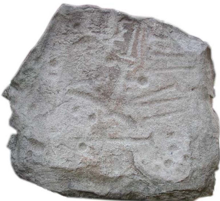
Fig. 4: stele istoriata di via Beati

La seconda , coperta da una fitta serie di coppelle e da segni ad ascia su una sola faccia, probabilmente collegati alla simbologia del fulmine, poteva anche avere una collocazione orizzontale e funzione di altare per offerte liquide.